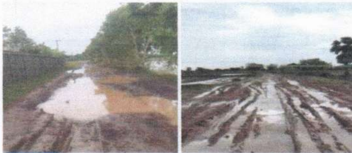
เพิ่มเต็ม

#อย่าให้ใครว่าจังหวัดเราขาดการพัฒนา #รบกวนช่วยกันแชร์หน่อยนะคะเห็นแก่เด็กๆที่ต้องเดินทางไปโรงเรียนทุกวัน