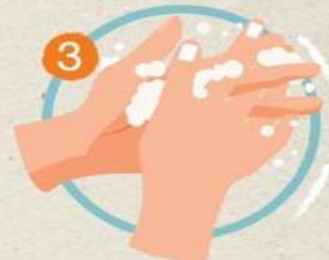
3 ใช้ฝ่ามือถูฝ่ามือ และนิ้วถูซอกนิ้ว