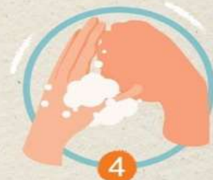
4 ใช้หลังนิ้วมือถูฝ่ามือ