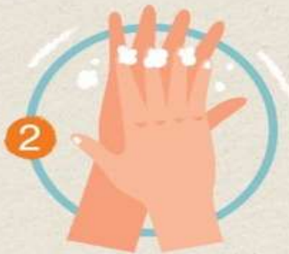
2 ใช้ฝ่ามือถูหลังมือ และนิ้วถูซอกนิ้ว