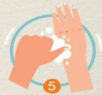
5 ใช้ฝ่ามือถูนิ้วหัวแม่มือ โดยรอบ