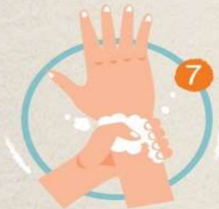
7 ใช้ฝ่ามือถูรอบข้อมือ