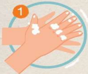
1 เริ่มล้างด้วยน้ำและสบู่ ใช้ฝ่ามือถูกัน