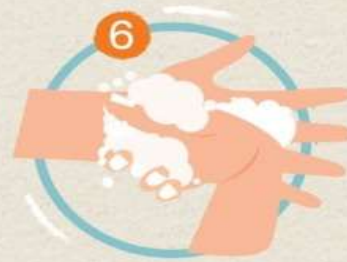
6 ใช้ปลายนิ้วมือ ถูขวางฝ่ามือ