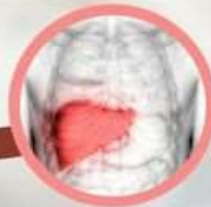
มะเร็งตับ

ขอขอบคุณผู้สื่อข่าวเพื่อสุขภาพ : นพ.วีรวัฒน์ กิตติรัตนไพบูลย์ นักตรึงรังสีเพื่อสิ่งแวดล้อม แพทย์ต้นแบบแพทยสภา ปี 2561