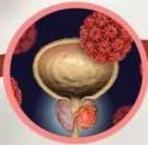
มะเร็งต่อมลูกหมาก