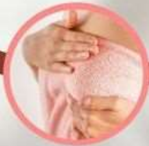
มะเร็งตับ