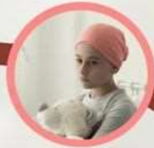
มะเร็งเม็ดเลือดขาว