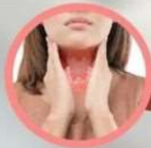
มะเร็งต่อมไทรอยด์