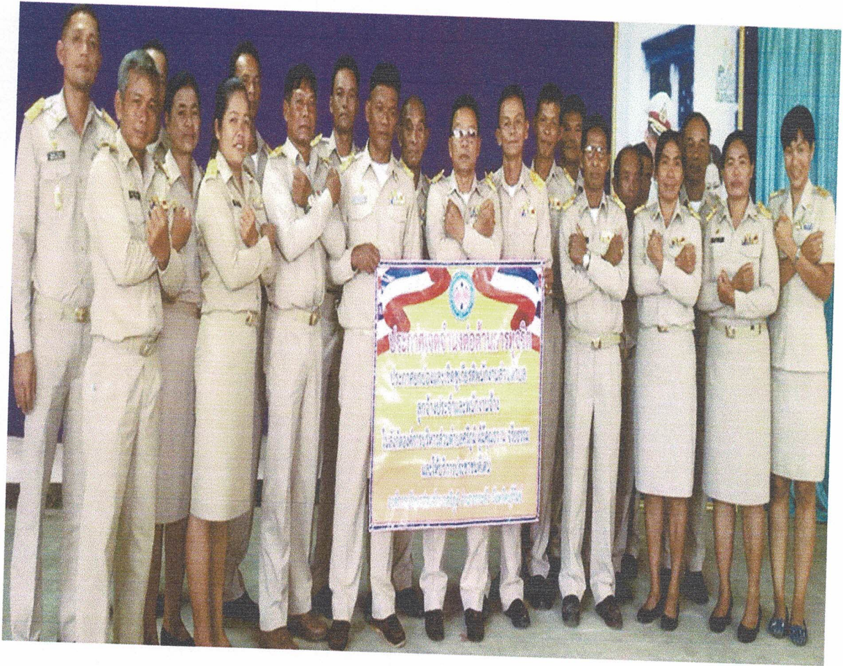
การแสดงเจตนารมณ์การป้องกันและต่อต้านการทุจริตคอร์รัปชันของบุคลากรในสังกัดองค์การบริหารส่วนตำบลศรีภูมิ